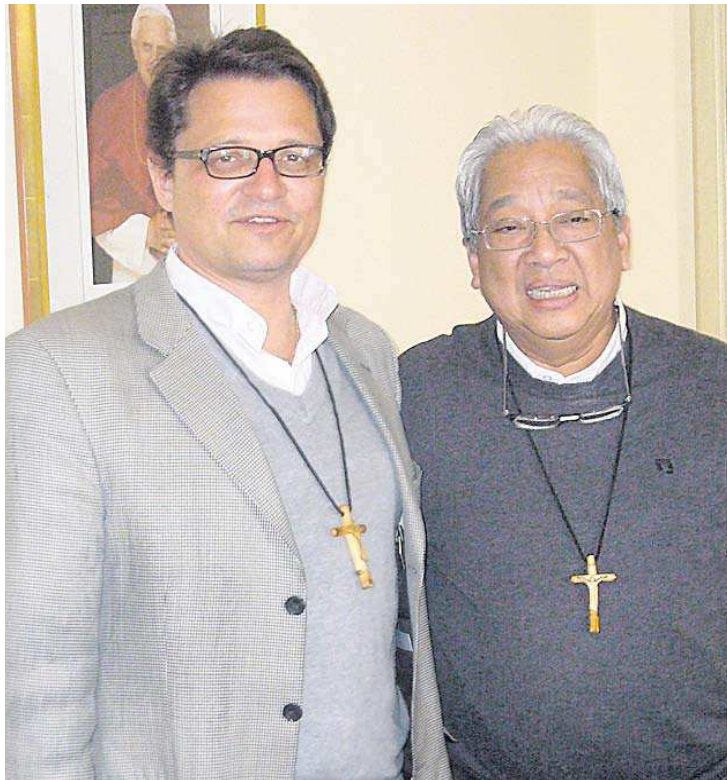
Vereint im Widerstand gegen Apeco: Bischof Gmür und Bischof Tirona.

schon bald zur wirtschaftlichen Entwicklung der Region beitragen. Klingt gut. Doch die Auswirkungen wären fatal. Indigene, Kleinbauern- und Fischerfamilien werden von ihrem Land vertrieben und ihrer Lebensgrundlage beraubt. Allein den