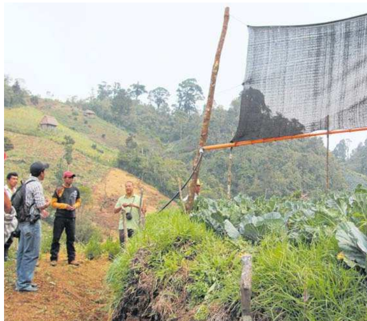
Tücher gewinnen Wasser aus dem Nebel: Innovation aus Guatemala.