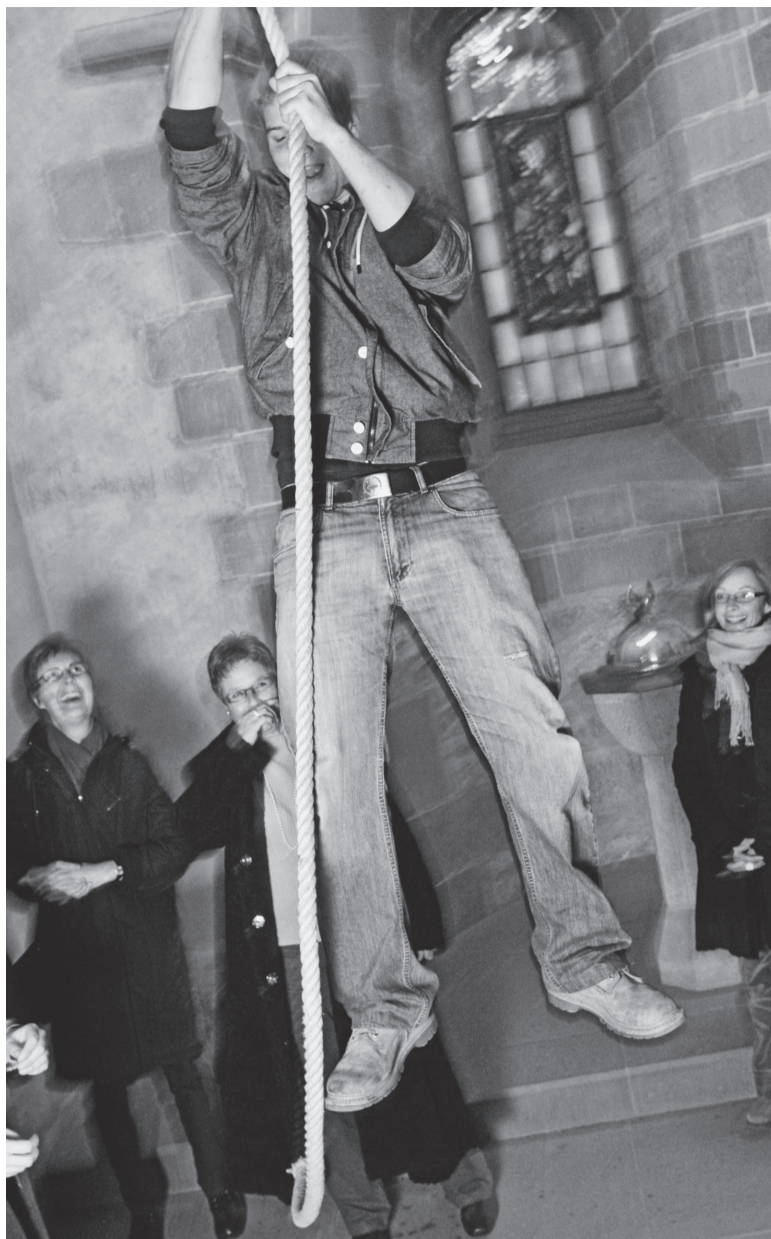
Die Kraft der Glocken: Anläuten gegen den Klimawandel in Schaffhausen.

FASTENOPFER Alpenquai 4, Postfach 2856 6002 Luzern Tel. 041 227 59 59, Fax 041 227 59 10 mail@fastenopfer.ch, www.fastenopfer.ch PC 60-19191-7